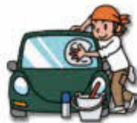
洗車をする 30分 = 142kcal