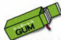
シュガーレスガムや キャンディ・タブレット

口寂しさを紛らわせる食べ物に注意する！ デスク周りに低カロリーの食べ物を数種類準備