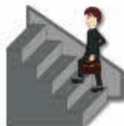
階段を上る 10分 = 65kcal