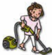
掃除機をかける 15分 = 39kcal