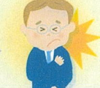
③ 心筋梗塞や脳卒中などの病気を発症