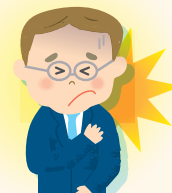
③ 心筋梗塞や脳卒中などの病気を発症