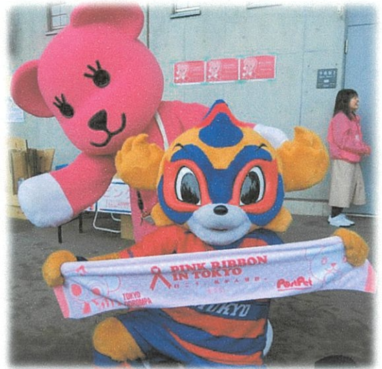
PostPet™ ©Sony Network Communications Inc.